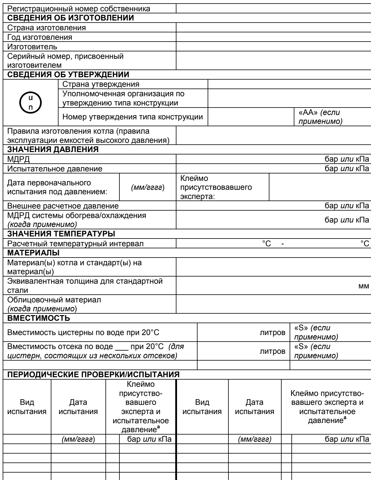
Рис. 6.7.2.20.1: Пример маркировки на идентификационной табличке

а Испытательное давление, если применимо.