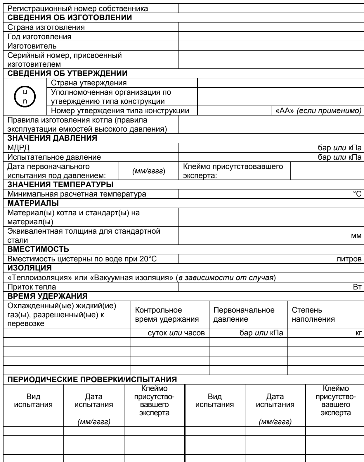
Рис. 6.7.4.15.1: Пример маркировки на идентификационной табличке